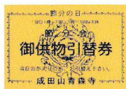
↑↑ お供物引換券 (黄色)